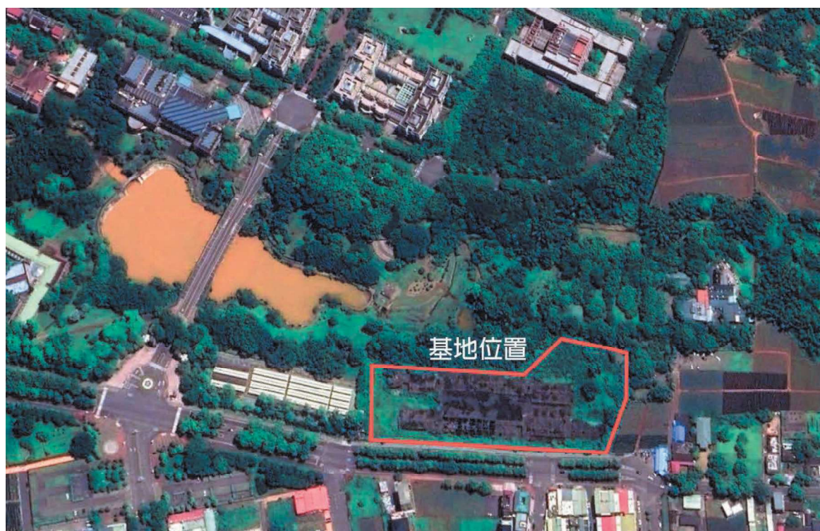
圖 4-2 基地位置

目前基地現場有留存 93 年興建廢棄之筏式基礎、一樓頂版等結構體，需一併拆除。(圖 4-2)